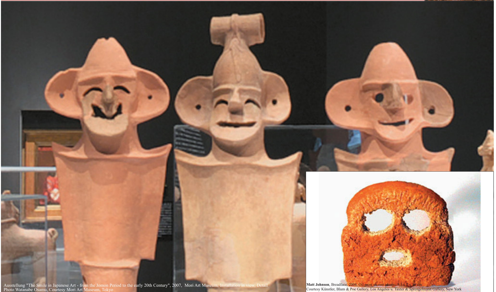
Ausstellung "The Smile in Japanese Art - from the Jomon Period to the early 20th Century", 2007, Mori Art Museum, Installation in view, Detail