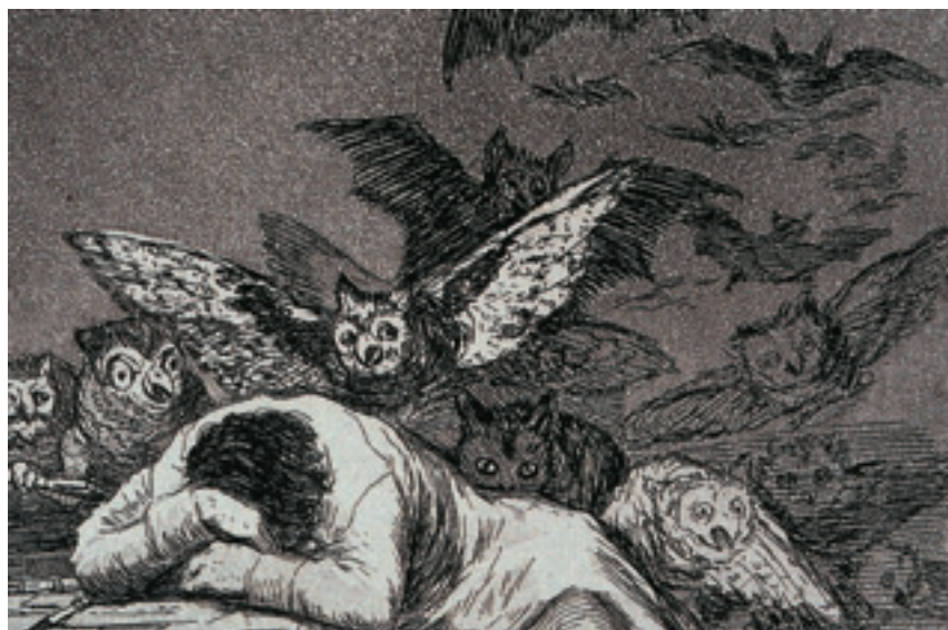
Francisco de Goya y Lucientes (1746-1828) „El sueño de la razón produce monstruos“ (Der Schlaf der Vernunft gebiert Ungeheuer), 1797/1798, Radierung, Aquatinta, 22 x 15,2 cm auf 36 x 26,4 cm, Ausschnitt, Wellcome Library, London