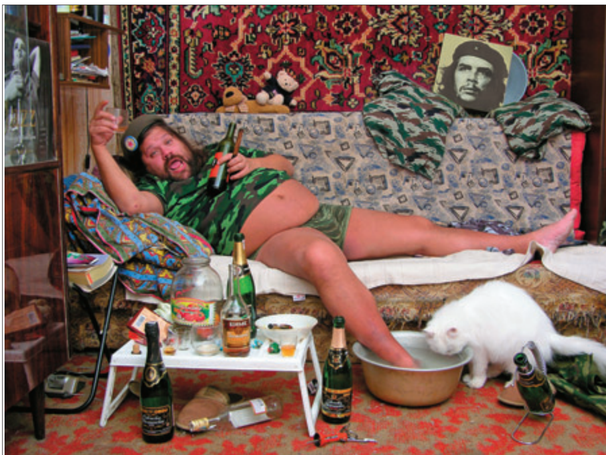
The Blue Noses, A Revolution Goes On, 2005, C-Print

Die nächste Ausstellung des Mori Art Museum ist Le Corbusier gewidmet (26.Mai bis 24. Sept. 2007)